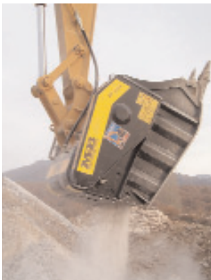
Το BF120.4 της MB S.p.A χρησιμοποιείται με μεγάλη αποδοτικότητα σε μια μεγάλη σειρά εφαρμογών στον κατασκευαστικό κλάδο.

Το μεγαλύτερο μοντέλο της γκάμας της MB Sp.A είναι το BF120.4. Ζυγίζει 4,9 τόνους και συνιστάται για εκσκαφείς με βάρος από 28 τόνους και άνω. Το άνοιγμα των σιαγόνων είναι 120x45 εκατοστά, ενώ η χωρητικότητα του κάδου είναι ένα κυβικό μέτρο. Το μέγεθος του θραυσμένου υλικού επιλέγεται από 20 έως και 120 χιλιοστά με μέση ωριαία παραγωγή από 25 έως 50 κυβικά