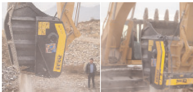
Το BF120.4 ζυγίζει 4,9 τόνους και συνιστάται για εκσκαφείς με βάρος από 28 τόνους και άνω.

Τα χαρακτηριστικά που εκτιμά κανείς στα μηχανήματα αυτά είναι η χρήση τους σε πολλούς τομείς, η δυνατότητα επιτόπου θραύσης ό-