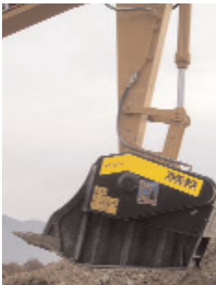
Το BF120.4 διακρίνεται για τη μεγάλη παραγωγικότητά του στα εργοτάξια.

Καθίσταται επίσης σαφέστατη η μείωση των συνολικών δαπανών, καθώς με το σύστημα αυτό υπάρχει δυνατότητα επαναχρησιμοποίησης των αδρανών υλικών, ενώ η δυνατότητα θραύσης διαφορετικών υλικών παρέχει τη δυνατότητα άμεσης χρήσης τους στο εργοτάξιο (πλήρωση θεμελίων, ερμωστώσεις κτλ.).