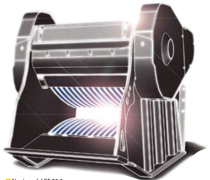
■ Novi model BF 90.3