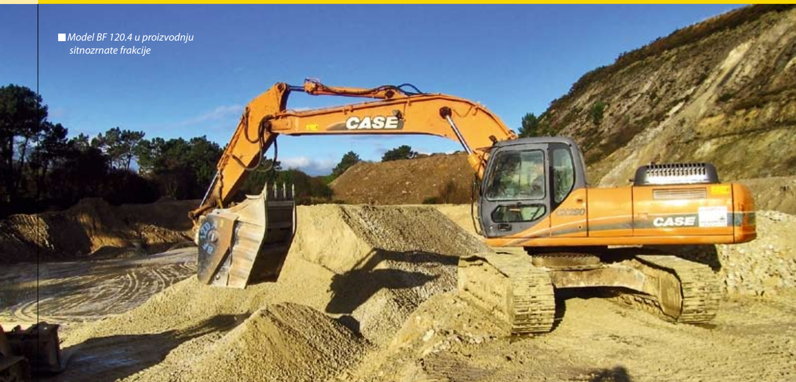
■ Model BF 120.4 u proizvodnju sitnozrnate frakcije