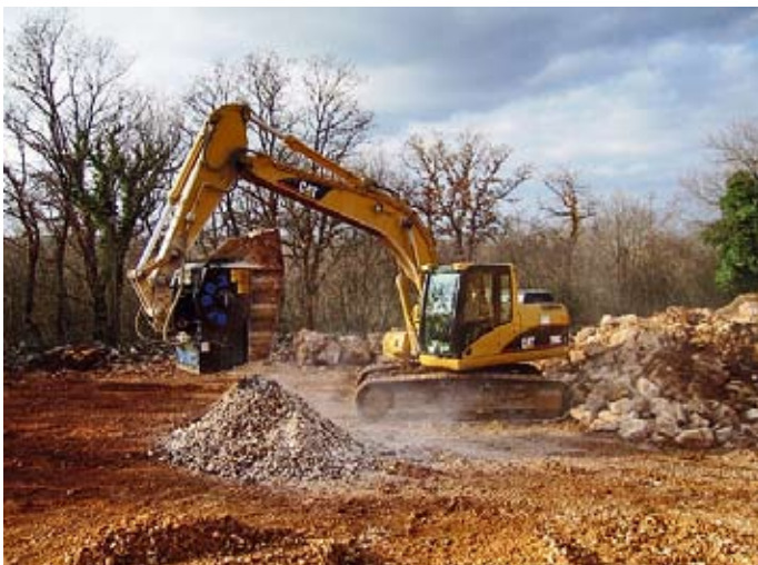
■ Model BF 90.3 u pogonu