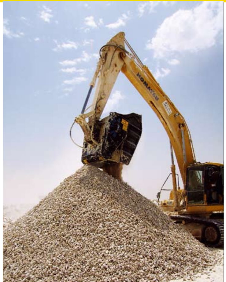
■ Model BF 120.4 u proizvodnji krupnozrnate frakcije