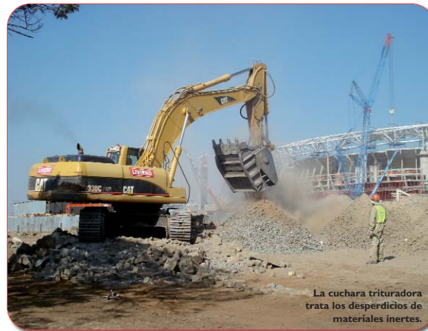
La cuchara trituradora trata los desperdicios de materiales inertes.

En el próximo mundial de fútbol que tendrá lugar en Sudáfrica en el 2010, Italia será uno de los protagonistas más aplaudidos. De hecho, la empresa que ha suministrado las máquinas para la construcción del nuevo estadio de Johannesburgo es vicentina. Las cucharas trituradoras de MB están siendo utilizadas actualmente en las obras del Soccer City Stadium, el estadio que el 11 de julio de 2010 acogerá las fuertes emociones de la final del mundial de fútbol.