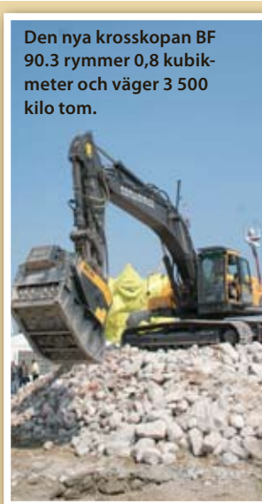
Den nya krosskopan BF 90.3 rymmer 0,8 kubikmeter och väger 3 500 kilo tom.