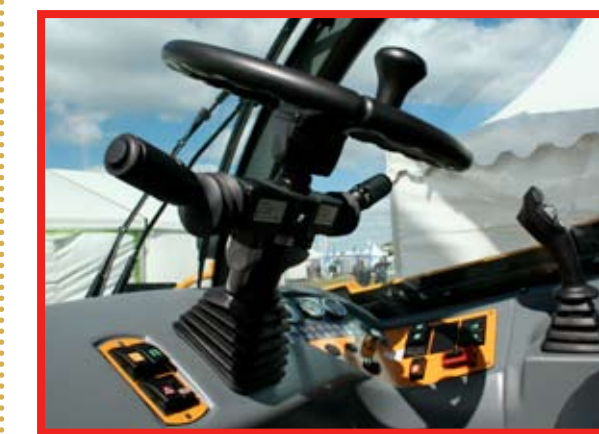
Inredningen i hytten på Haulotte HTL 4017 är mycket trevlig och alla reglage har en bra placering.