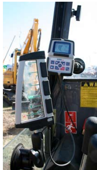
DISPLAY. Abelcos grävsystem har en monitor för alla inställningar och en display som visar föraren hur redskapets ska röras för att följa programmerad rörelse.