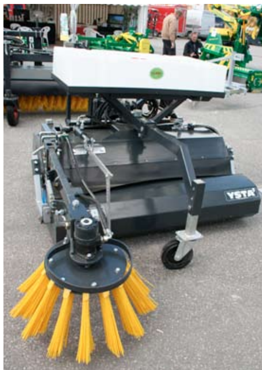
SOPPBORSTE MED VATTENTANK. Ysta Maskiner har tagit fram en komplett sopborste med vattentank och hydrauliskt driven sidoborste för priset 52 000 kronor. Den är 1,5 meter bred och klarar sig med 1 dubbelverkande uttag på traktorn.

FÖRETAGET MTT har en ny siktskopa som heter Remu SBF 1300. Den har en ny form av sorteringsvalsar i skopan med rundare form.