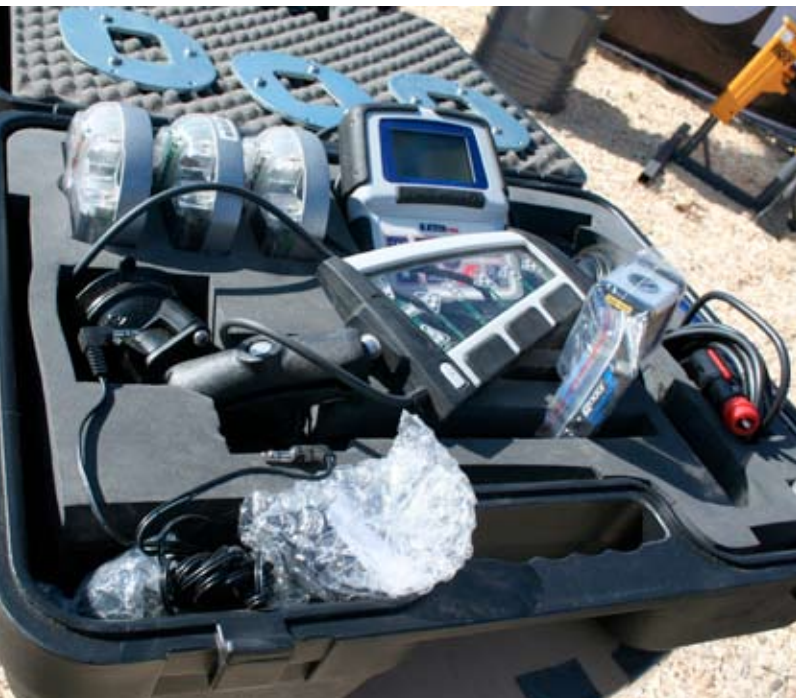
HJÄLPREDA. Datorn kan programmeras och hålla reda på fem maskiner med vardera nio redskap. Det är bara att flytta från den ena maskinen till den andra. Max 30 minuter tar det enligt återförsäljaren.