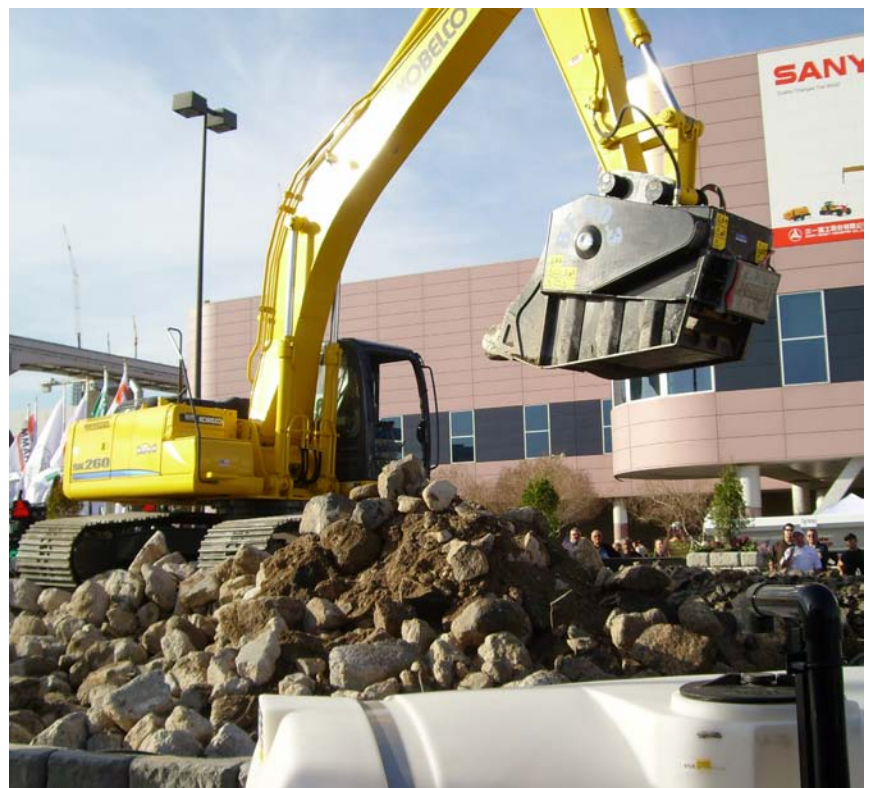
Meccanica Breganzese y Giberson Enterprise mostraron todo su potencial en un stand único en la última edición de Conexpo 2008, en Las Vegas.

La visita permite al cliente ver, sin necesidad de recurrir a la imaginación, al producto en su realidad específica. Al mismo tiempo, el personal de la compañía ofrece las explicaciones necesarias que pueden ayudar a mejorar el proceso productivo de cada empresa. El campo de pruebas, situado próximo a la sede de Breganze, está abierto todo el año incluyendo los días festivos y la única formalidad requerida es la reserva de la visita.