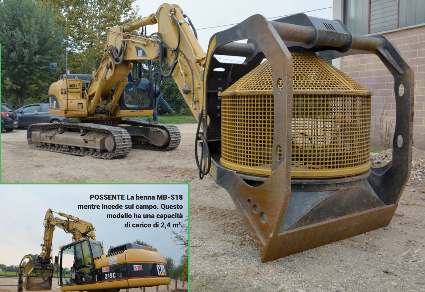
POSSENTE La benna MB-S18 mentre incede sul campo. Questo modello ha una capacità di carico di 2,4 m 3 .