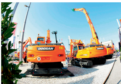
Oranje, aber aus Belgien: Doosan

Doosan Infracore Construction Equipment, ansässig in Waterloo/Belgien, zeigte auf der Bauma die Gründe auf, die das Unternehmen an die Spitze der Branche gebracht haben. Entscheidend ist die Stärke der Allianz, die durch den Zusammenschluss von Marken wie Bobcat, Ingersoll Rand und Moxy in den letzten drei