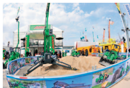
Sandkasten für große Kinder: Avant

Präsenz zeigten ferner die finnische Firma Avant Tecno, die sich mit Multi-