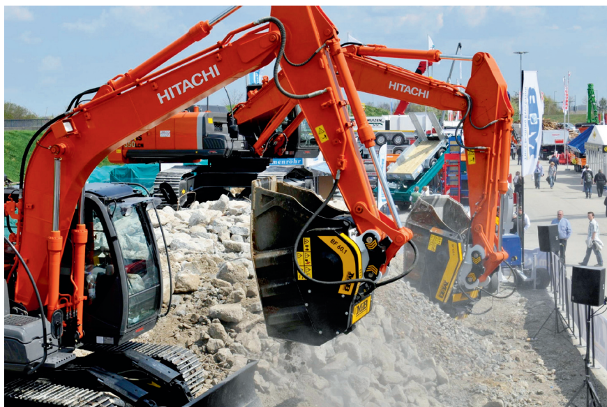
Demoaktion am MB-Crusher-Stand

Fliegl Bau- & Kommunaltechnik GmbH Söderbergstraße 5, D-84513 Töging