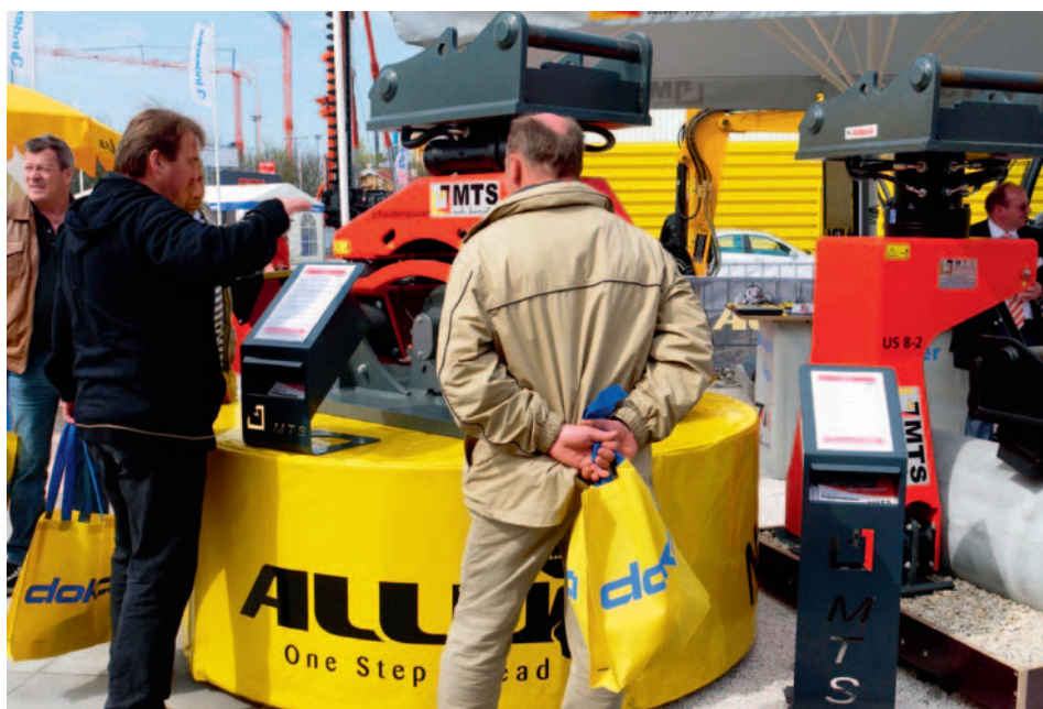
Mit Deutschland-Präsenz in Bünde: Allu aus Skandinavien

Hitachi Construction Machinery (Europe) NV (HCME) mit Sitz in Amsterdam und sein deutscher Exklusivpartner Kiesel präsentierten gemeinsam jenseits aller Showeffekte zahlreiche neue Modelle. Stars waren unter anderem die Minibaggermodelle ZX18-3 und ZX27-3 sowie eine Reihe von innovativen Kurzheckbaggern