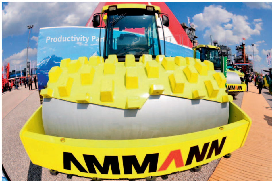
Grüezi, Bauma-Besucher: Ammann

onsstätten im belgischen Bullingen und im luxemburgischen Lentzweiler, vertreten. Der Hersteller von Aufliegern und Tiefladern für den Spezialtransport zeigte neben der Modulmax-Reihe auch die weiterentwickelte Prefamax-Serie für den Transport von Betonfertigteilen bis zu einer Höhe von 4 m. Zu sehen war unter anderem auch ein für den Transport von langen Betonträgern ausgelegtes Flexmax-Modell als 4-Achser.