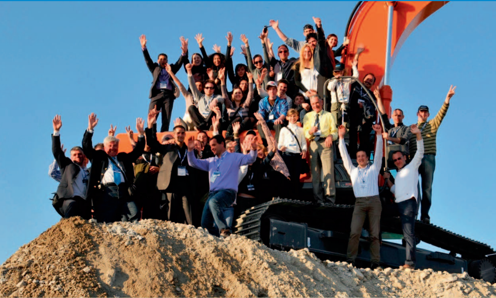
Italienische Lebensfreude: das Team von MB Crusher aus Vicenza