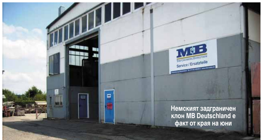
Немският задграничен клон МВ Deutschland е факт от края на юни