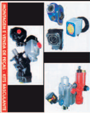
MONTAGEM E VENDA DE PEÇAS - BITS BASTILANTE