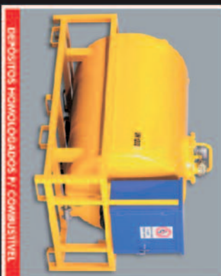
DEPOSITOS HOMOLOGADOS P/ COMBUSTIVEL