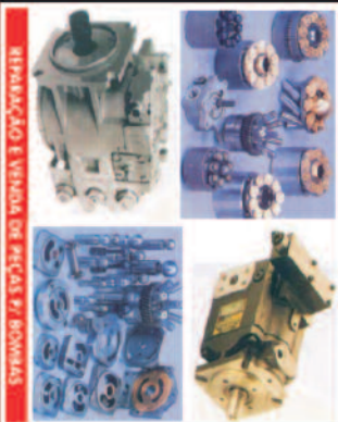
REPARAÇÃO E VENDA DE PEÇAS P/ BOMBAIS