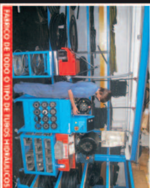
FABRICO DE TODO O TIPO DE TUBOS HIDRÁULICOS