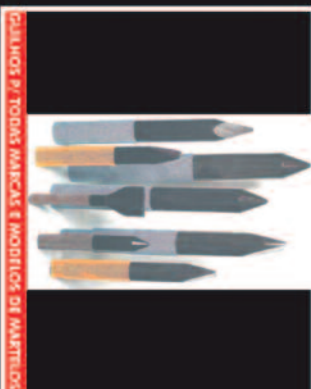
GUINHOS P/ TODAS MARCAS E MODELOS DE MARTELOS