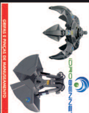
CARRAS E PINÇAS DE MANUSEAMENTO