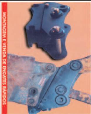
MONTAGEM E VENDA DE ENGATES RÁPIDOS