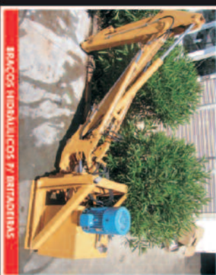
BRACOS HIDRÁULICOS P/ BETAPOSTAS