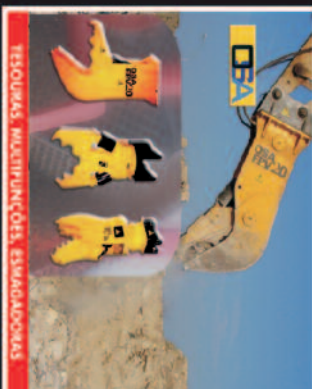
RESOLUKAS MULTIFUNÇÕES, ESMALADOKAS