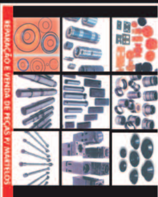
REPARAÇÃO E VENDA DE PEÇAS P/ MARTELOS