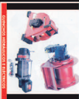
GUINCHOS HIDRÁULICOS E ELÉCTRICOS