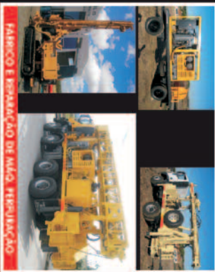
FABRICO E REPARAÇÃO DE MÁQ. REPARAÇÃO